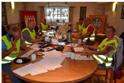
I fjor endte NR-forhandlingene med streik

kvalifisert personell, øker faren for ulykker.