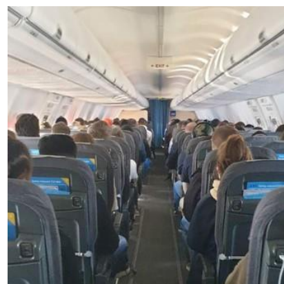
Bilde tatt 21.04.20 på SK 4011 fra Oslo til Stavanger