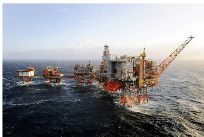
Nedbemanning på Valhallfeltet.

Situasjonen for våre medlemmer i forbundene i olje- og leverandørindustrien, SAFE og Negotia, krever aktiv handling, og YS støtter forslaget om utsettelse av skatt gjennom direkte utgiftsføring, slik at selskapene får fradrag for hele investeringskostnaden, inklusive friinntekten, samme år som investeringene foretas.