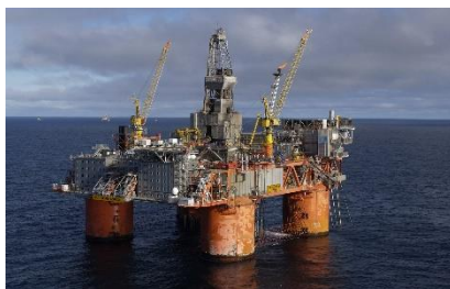
Snorre A

Forlengelse av gyldighet på sikkerhets- og beredskapskurs opphører 1. november