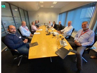
SAFE sitt engere utvalg med Norsk olje & gass

SAFE og Norsk olje og gass (NOG) kom ikke til enighet under årets lønnsforhandlinger på Oljeovernskomsten Sokkel. Etter to dagers forhandlinger stod partene langt fra hverandre. NOG hadde ingenting å tilby. Forhandlingene går nå til mekling.