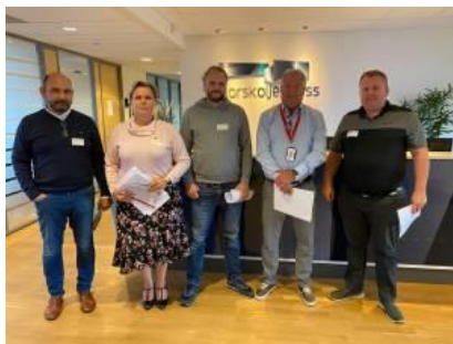
SAFE sitt engere utvalg: (fra venste):

Forhandlinger på oljeoverenskomst sokkel mellom NHO/Norsk olje og gass og YS/SAFE startet mandag 7. september i Stavanger. Det ble satt av to dager til forhandlingene. Oppgjøret ble utsatt i flere måneder på grunn av korona-situasjonen. Mye måtte gjøres annerledes i år, så de fysiske forhandlingsdelegasjonene for alle parter var kraftig redusert med kun 10 personer for SAFE, Lederne og IE. Resten av forhandlingsdelegasjonene deltok via eget møterom på Teams.