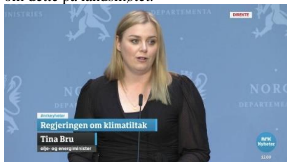
Tina Bru, olje- og energiminister

Regjeringen har godkjent Langskip , et prosjekt som skal fange og lagre CO2 i Brevik. SAFE har jobbet for dette i mange år og hatt resolusjoner om dette på landsmøtet.