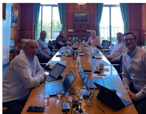
Forhandlingsutvalget i Oslo

Engere utvalg var fysisk til stede i Oslo og forhandlet i NR sine lokaler. Øvrige klubber var representert på Teams, og til sammen var dette forhandlingsutvalget.