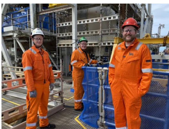
SAFE på arbeidsplassbesøk på Rosenberg

SAFE var på arbeidsplassbesøk på Rosenberg-verftet i Stavanger. Her ligger Jotun-skipet i tørrdock etter 20 års drift i Nordsjøen på Jotun-feltet. Produksjonsskipet blir for tiden pusset opp for en ny periode på sokkelen, men denne gangen på Balder-feltet, der det ble nylig gjort oljefunn i letebrønnene King og Prince.