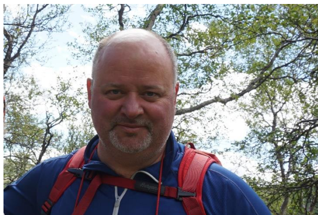
Idar Helle

– Alle er enige at industrien vår trenger et løft, sier Teige. Vi mottok rapporten, den er nå oversendt til partiene som sitter i regjeringsforhandlingene. Vår forventning nå er at rapporten blir en del av regjeringsplattformen, at de vil bygge industrisatsingen framover basert på denne.