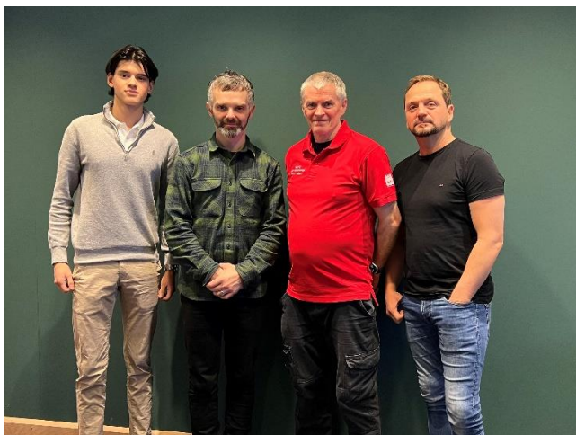
En del av styret i SAFE i Noble

SAFE i Noble er en nyetablert klubb på NR-området, som tilhører flytteriggavtalen. Klubben hadde sitt første årsmøte i Stavanger 18. - 19. januar. Velkommen til SAFE!