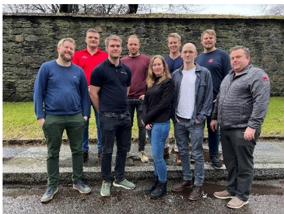
Tillitsvalgte på sjøfart offshore

Onsdag og torsdag denne uken hadde tillitsvalgte på tvers av klubbene i sjøfart offshore et strategimøte i Bergen.